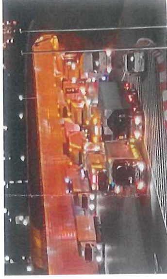
【東京本線料金所前の滞留状況】 (R2.12.23(水)23:58撮影)

社会資本整備審議会 国土幹線道路部会の中間答申(R3年8月)で示された見直しの方向性